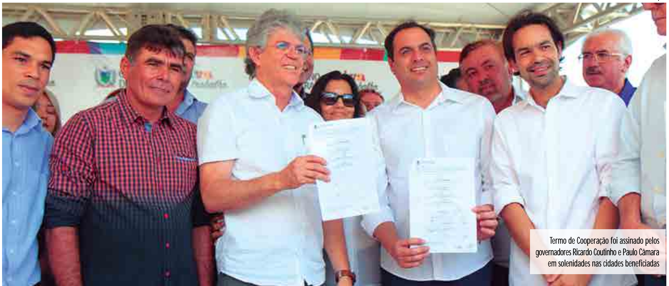
Termo de Cooperação foi assinado pelos governadores Ricardo Coutinho e Paulo Câmara em solenidades nas cidades beneficiadas