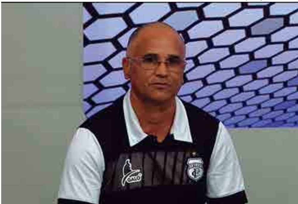
Oliveira Canindé vai ter problemas para escalar o time no jogo do Paraibano por causa de outro jogo na terça

Wellington Sérgio wsergionobre@yahoo.com.br