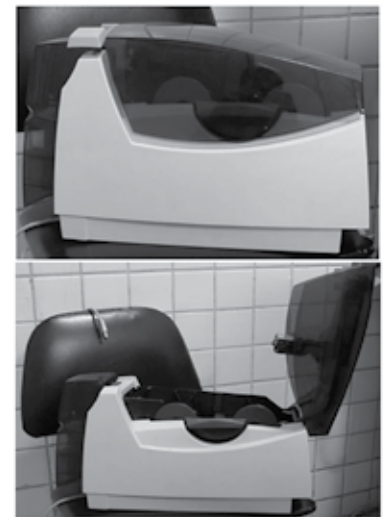
IMPRESSORA DE CARTÕES:

Impressora apreendida em poder de investigado na OPERAÇÃO FIREWALL, utilizada para confeccionar cartões de identificação, de presentes e de fidelidade, cartões de associados, cartões-chave para quartos de hotéis, entre outros. Produz uma impressão colorida, com fotos, com logomarcas, código de barras e opcionais para codificação de tarja magnética e cartões inteligentes - Smart Card ( http://www.classificados.com/impressora-de-cartao-de-pvc-em-promocao-30631 ).