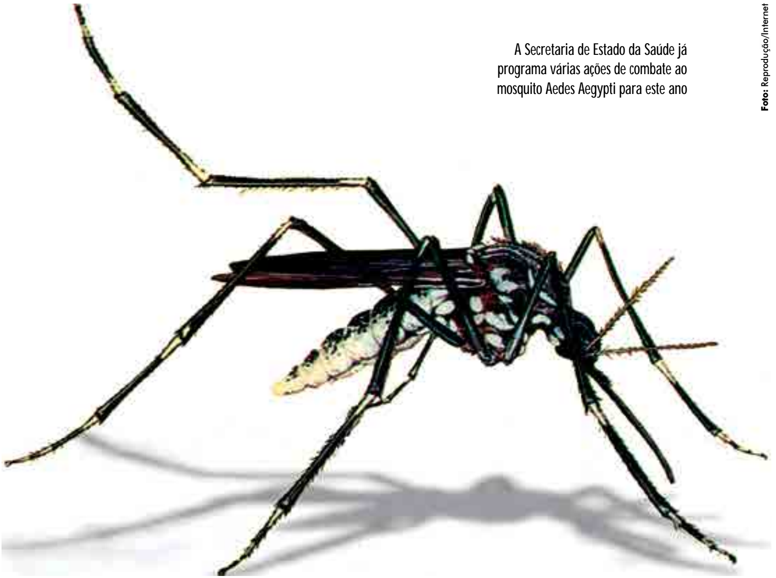
A Secretaria de Estado da Saúde já programa várias ações de combate ao mosquito Aedes Aegypti para este ano

Entre as ações programadas para 2018, de combate ao mosquito Aedes aegypti , estão o manejo clínico das arboviroses programado para o primeiro semestre; monitoramento e acompanhamento da situação epidemiológica e ambiental pelas áreas técnicas; mobilização e distribuição de material educativo referente as arboviroses; apoio técnico in loco conforme situação epidemiológica e ambiental dos municípios; intervenção do carro fumacê respeitando os critérios epidemiológicos e entomológicos estabelecidos na Nota Técnica Nº 01 de 2013.