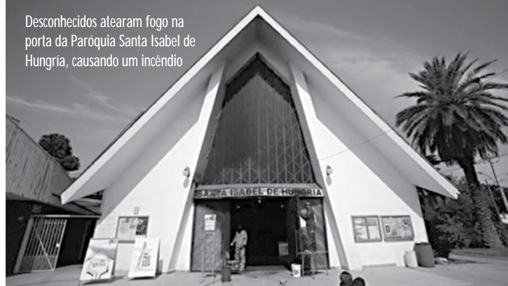
Desconhecidos atearam fogo na porta da Paróquia Santa Isabel de Hungria, causando um incêndio