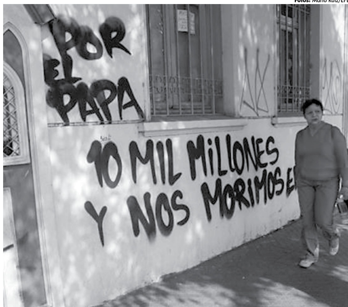
Os muros da Igreja Cristo Pobre foram pichados com mensagens contra a visita do papa Francisco ao Chile