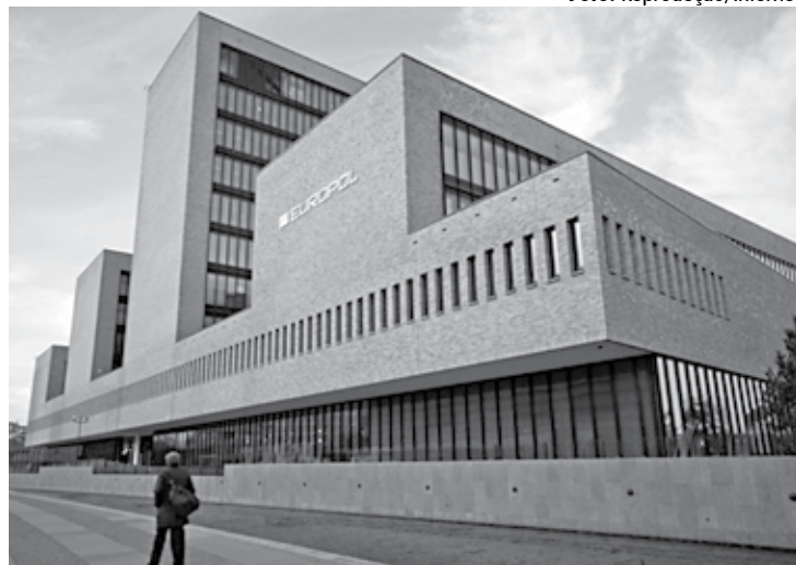
A campanha antiterror foi lançada na sede da Europol, em Haia, Holanda