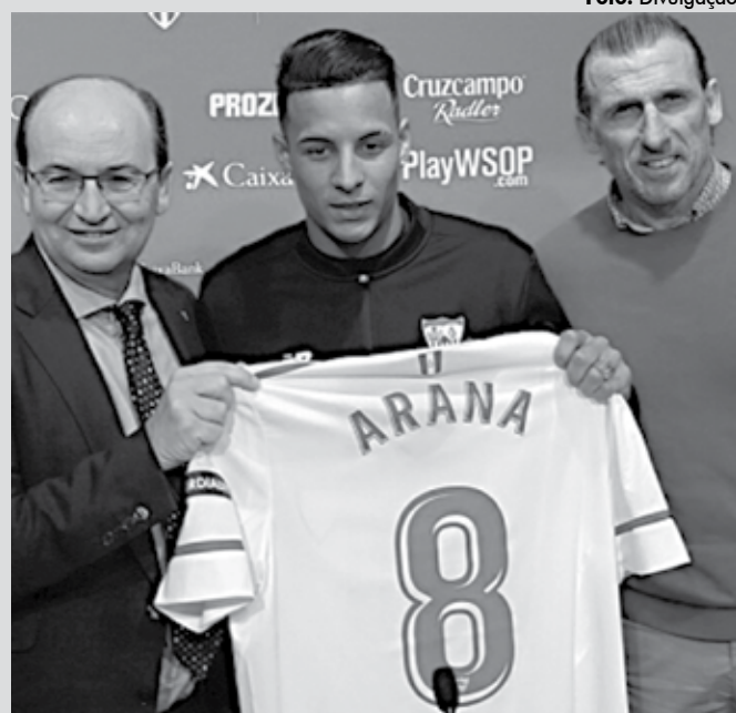
Arana diz que está ansioso e pronto para jogar no Sevilla