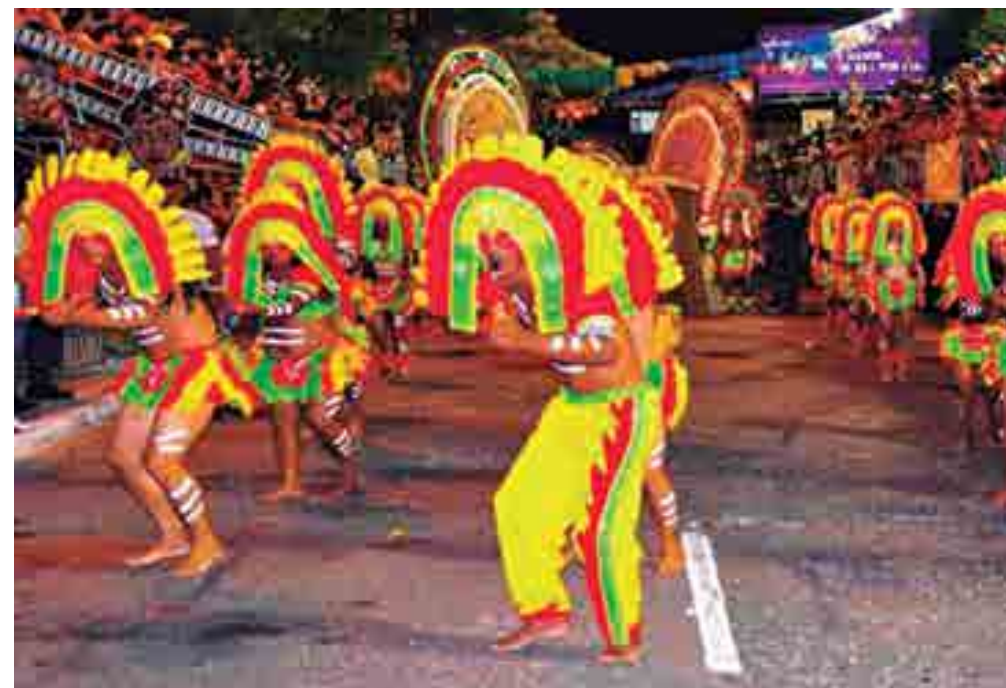
Tribos indígenas existentes em alguns bairros da cidade também atraem o interesse da população

De acordo com a programação divulgada pela Funjope, são 18 agremiações que participam das prévias carnavalescas, que foram iniciadas ontem, no Bairro de Jaguaribe. O evento é gratuito.