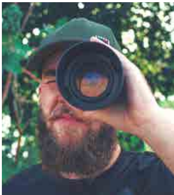
Trabalhos de Jordy Ribeiro encontram-se no Instagram @jordyfotografo