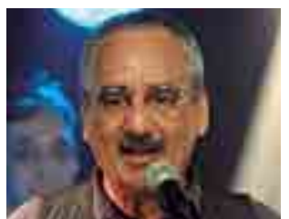
Corpo do artista foi sepultado ontem, no Rio de Janeiro