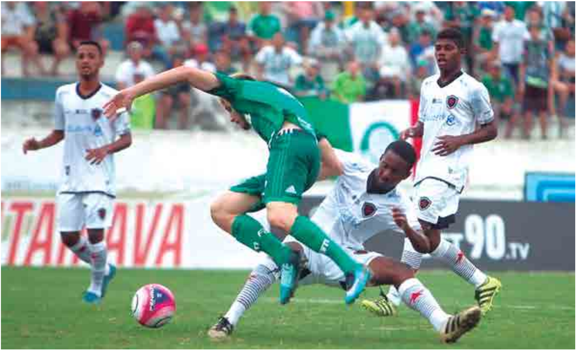
Belinho conseguiu segurar um rival superior no primeiro tempo do duelo, mas na etapa final prevaleceu o maior investimento e a melhor qualidade dos palmeirenses, que marcaram duas vezes

Já na primeira etapa, o Porco tinha sido superior, perdendo boas chances de abrir o marcador. O Belo, por sua vez, tentava de todas as formas segurar o ímpeto do adversário. O 0 a 0 na etapa inicial foi um grande resultado para o time paraibano, que buscava os contra-ataques para surpreender a equipe paulista.