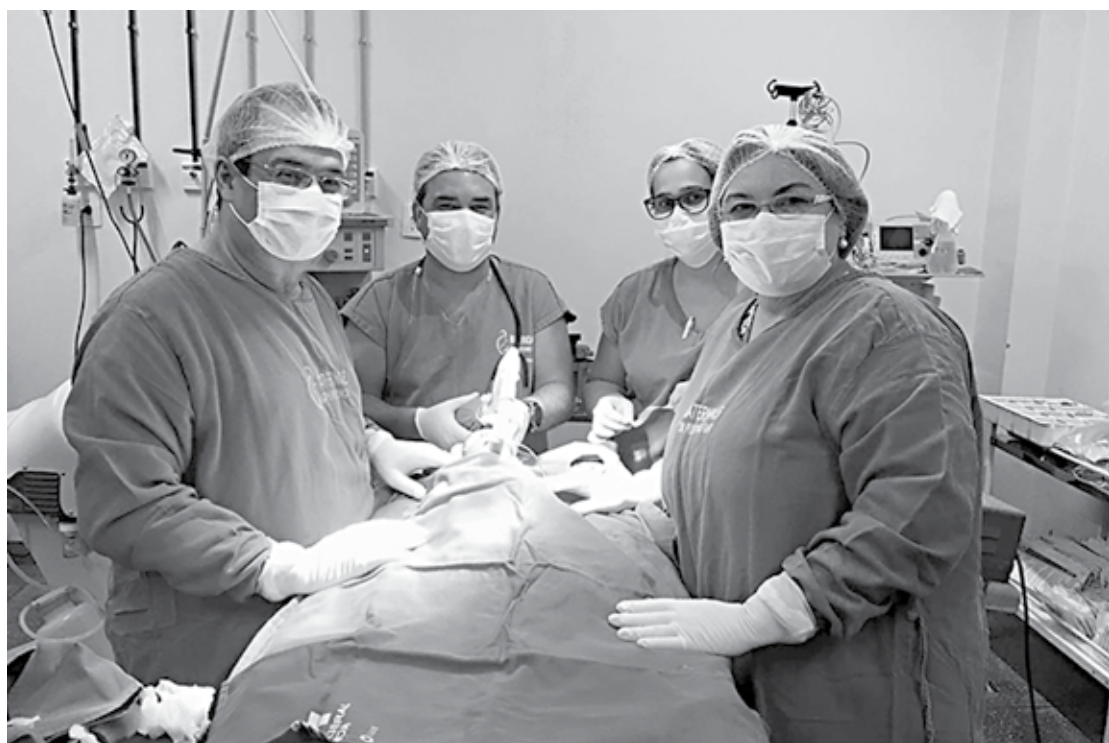
Recém-nascido precisava colocar um traqueostomo e passar por uma gastrotomia; procedimento foi feito com sucesso

O Empreender PB tem como prioridade a concessão de crédito produtivo orientado com o objetivo de incentivar a geração de ocupação e renda entre os empreendedores, além de apoiar e fortalecer a economia solidária, o microempreendedor individual, o microempresário, o empresário de pequeno porte, as cooperativas de produção e as prefeituras que pretendem viabilizar projetos voltados para o desenvolvimento local do empreendedorismo.